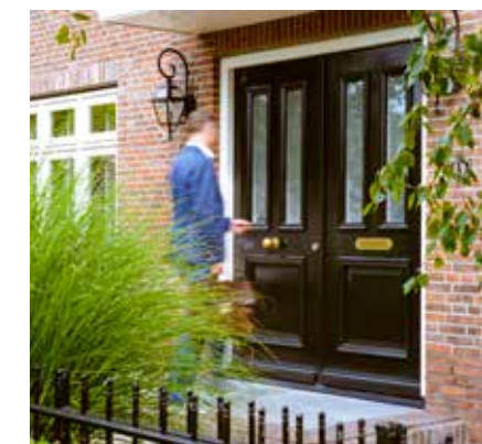
Met een deur waar het GND-garantielabel op zit, weet men zich verzekerd dat er aan alle technische vereisten voldaan wordt, waaraan deuren moeten voldoen.

Breeel schetst hoe innovaties doorgevoerd worden: "De aangesloten fabrikanten innoveren individueel, waarbij wij als stichting een helicopterview hebben op de ontwikkelingen. Wij kijken naar de overkoepelende meerwaarde van de innovatie voor alle marktpartijen. Als stichting zorgen we voor de instrumenten om de markt te bewerken en dat we voorkomen in bestekken." ■